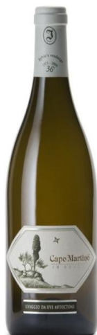
Capo Martino Cod. 1512602