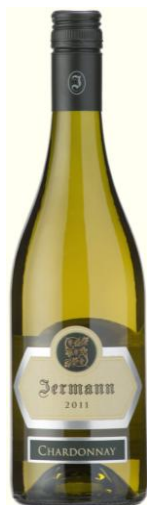
Chardonnay Igt Cod. 1512515