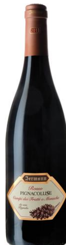
Pinacolusse Igt Cod. 1512516