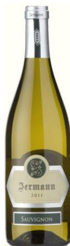
Sauvignon Igt Cod. 1512520