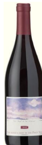
Red Angel Igt Cod. 1511552