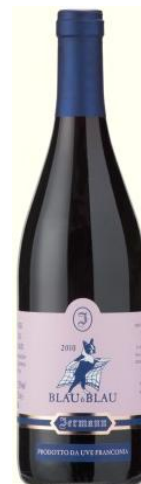
Blau & Blau Igt Cod. 1512524