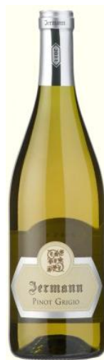
Pinot Grigio Igt Cod. 1512518