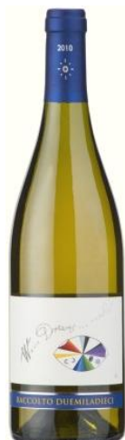
Where Dreams... Cod. 1512012